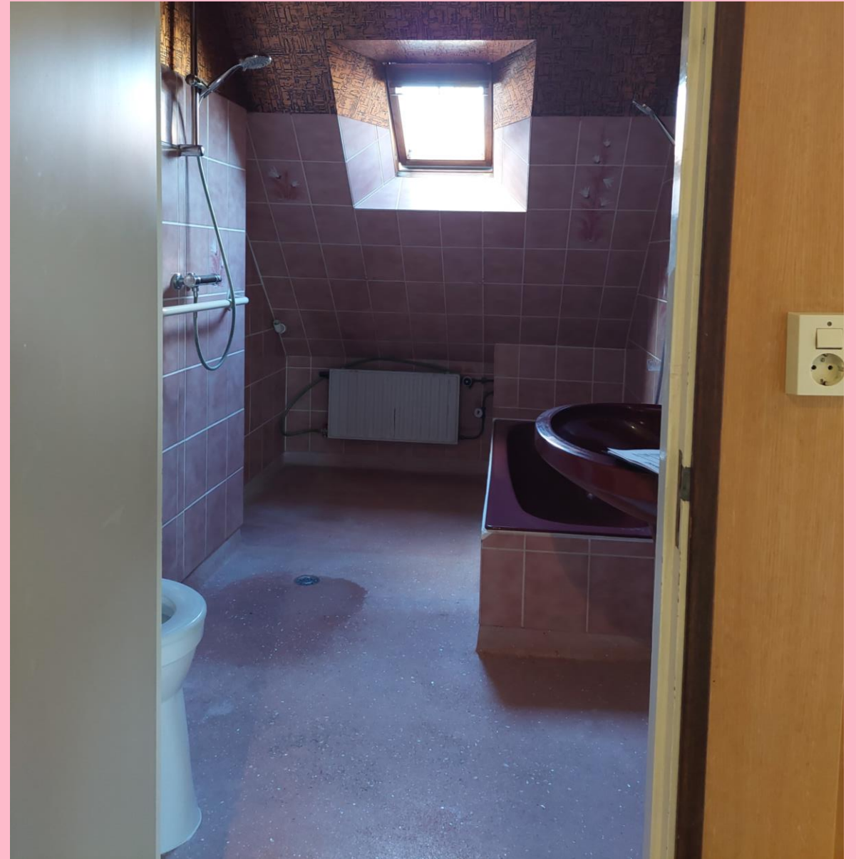
Lieven de Key