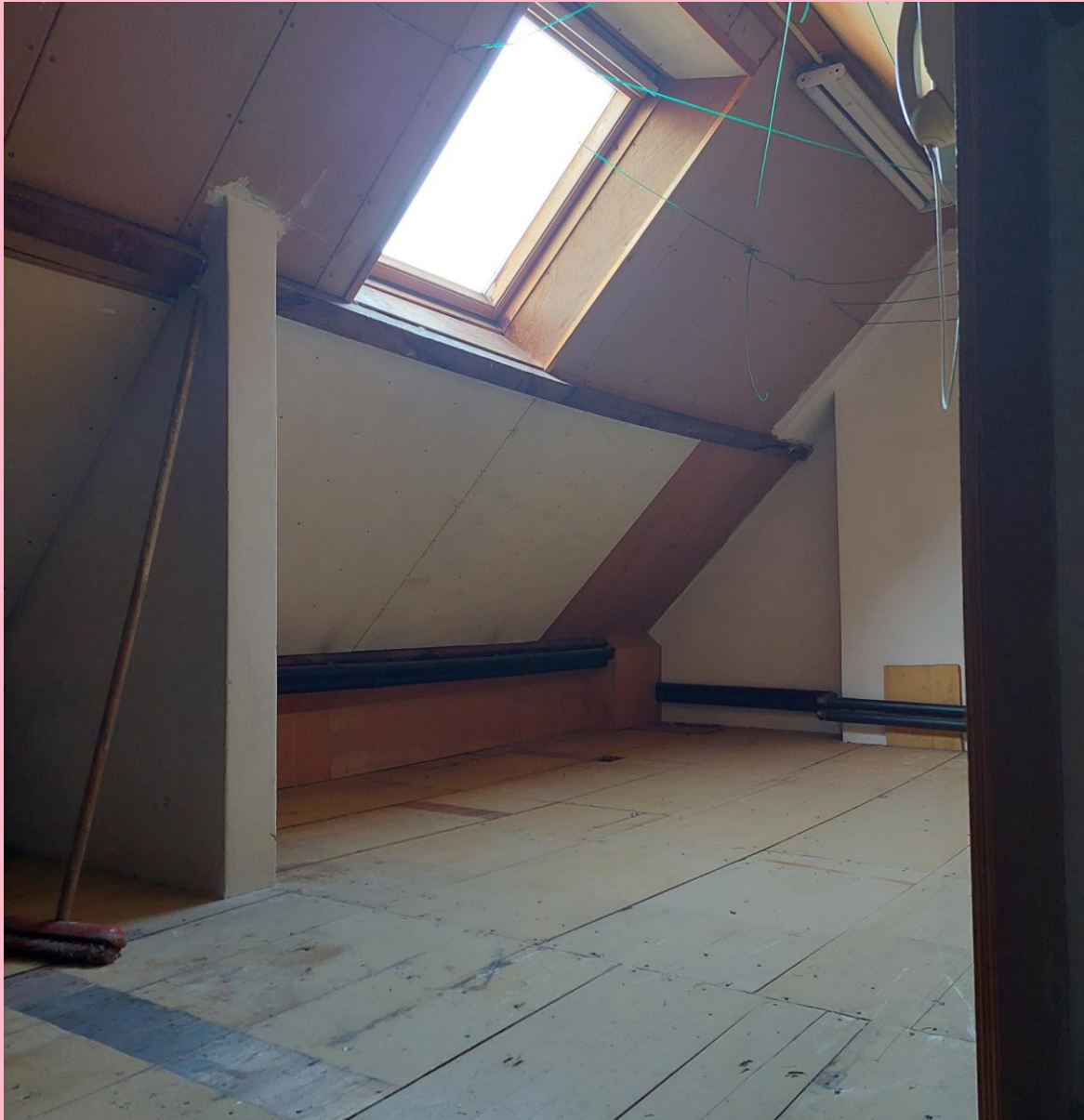
Zelf aangebrachte voorzieningen, voorbeelden